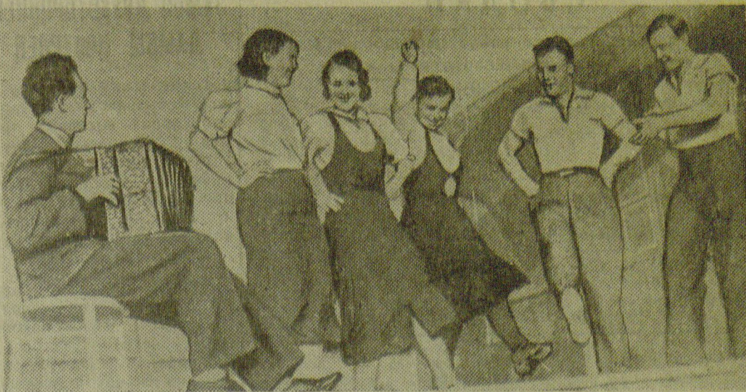
Молодежь Ново-Александровского района (участок № 10) в часы досуга.